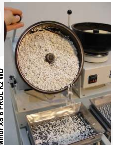
Minor XS 6 PRO K2 WD

Le versioni "Kombi" sono l'insieme di almeno due unità vibranti con o senza una unità accessoria tipo MINI-MAG (magnetico). Un telaio in acciaio supporta le unità vibranti che possono essere DRY oppure WET, con una pompa dosatrice, azionata automaticamente, e una vaschetta inferiore di raccolta reflui. Entrambe le unità vibranti basculanti possono scaricare in una apposita vaschetta, con setaccio inox. L'unità MINI-MAG-15-V-GM ha una vasca trasparente intercambiabile da 15 lt. nominali. Vedi tabella dei modelli a pag. 6.