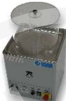
Mini Mag 15 V GM