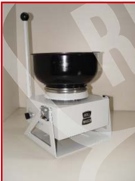
Minor XS 6 GM PROL