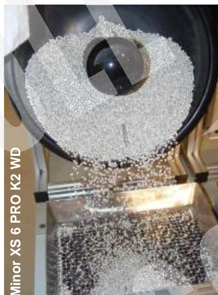
Minor XS 6 PRO K2 WD