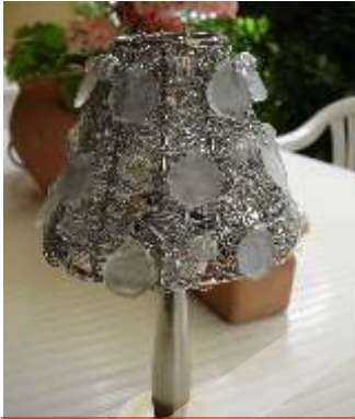
alcuni esempi, by Rollwasch®

The series Minor XS offers the possibility to approach the world of vibratory finishing in a simple and practical way.