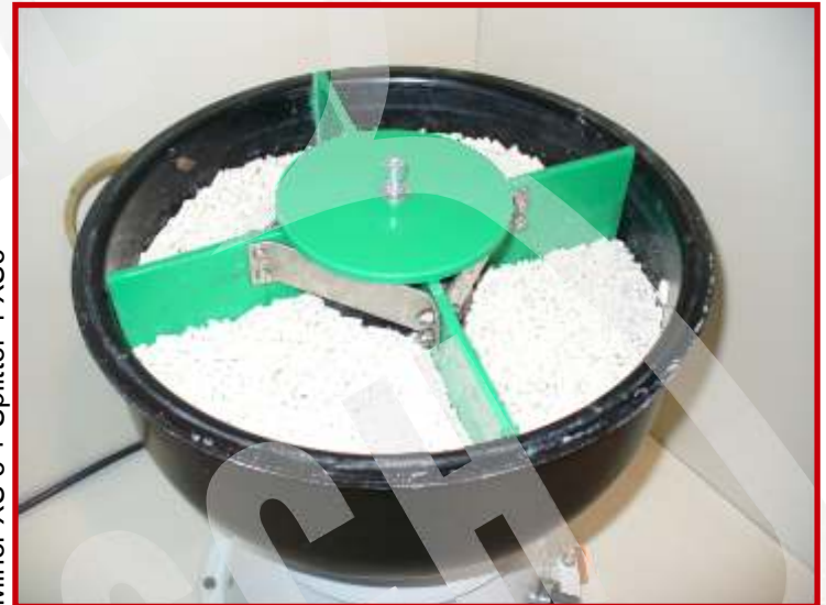
Minor XS 6 + Splitter 4 XS6

Minor XS 6 , per esempio, senza il cilindro centrale, può effettuare trattamenti di pulizia e lucidatura di oggetti grandi e complessi come un paralume in filo di acciaio con pendenti in vetro. Con il cilindro montato, può lucidare articoli più piccoli di svariati tipi e materiali.