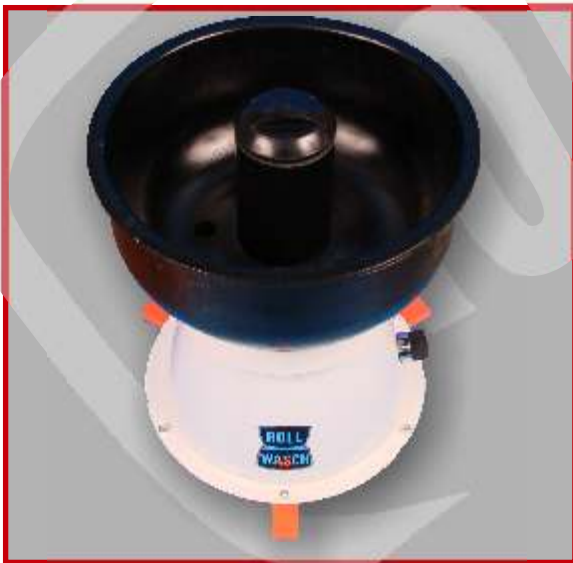
Minor XS 6 XT