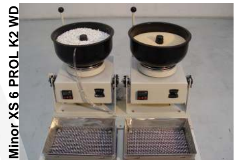
Minor XS 6 PRO K2 WD