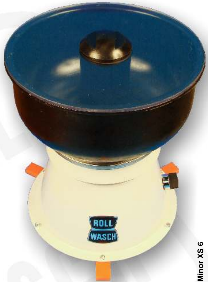
Minor XS 6

I vari modelli della serie Minor XS si distinguono per una serie di caratteristiche e dotazioni, riassunti qui di seguito e riportati nella tabellina qui sopra.