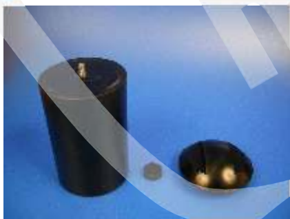
Accessori smontati Dismounted accessories