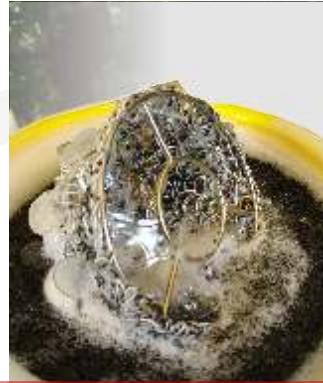
few examples, by Rollwasch®