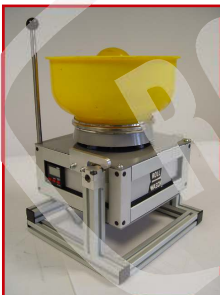
Minor XS 6 PRO