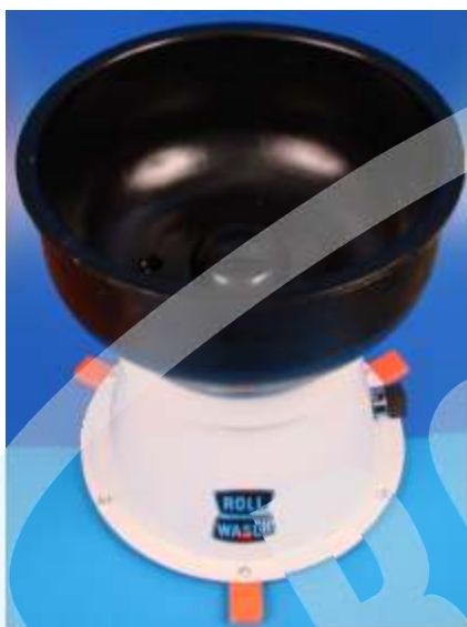
Minor XS 6 XT senza cilindro centrale Minor XS 6 XT without central cylinder