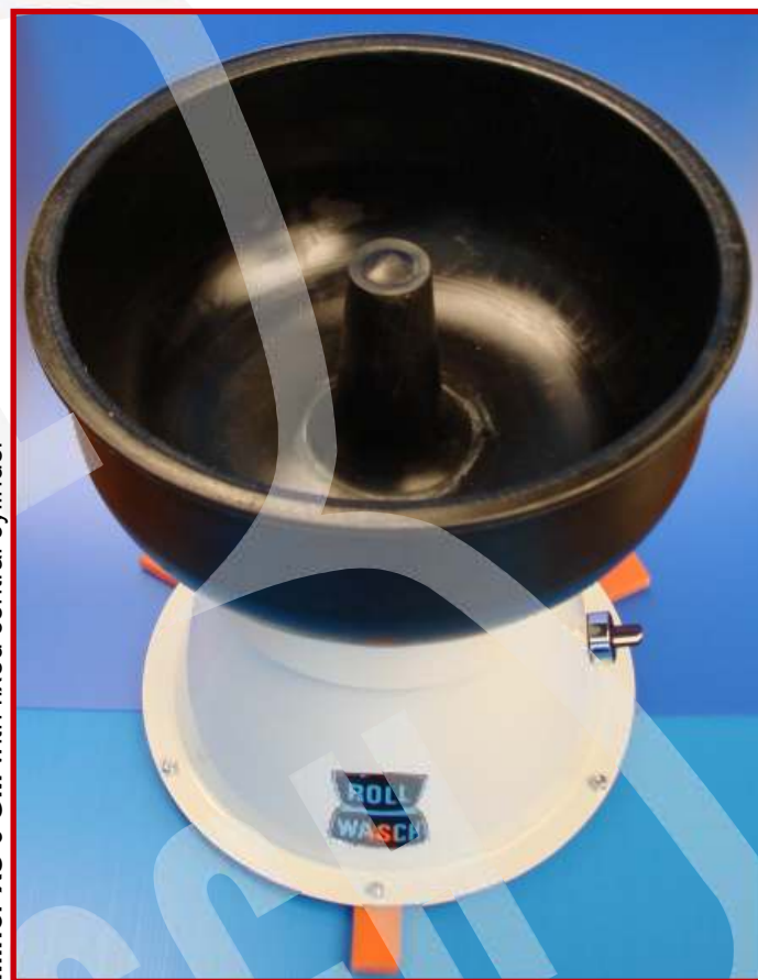
Minor XS 6 GM con cilindro centrale fisso Minor XS 6 GM with fixed central cylinder

Migliaia di applicazioni possibili, MINOR-XS è un'apparecchiatura estremamente versatile.