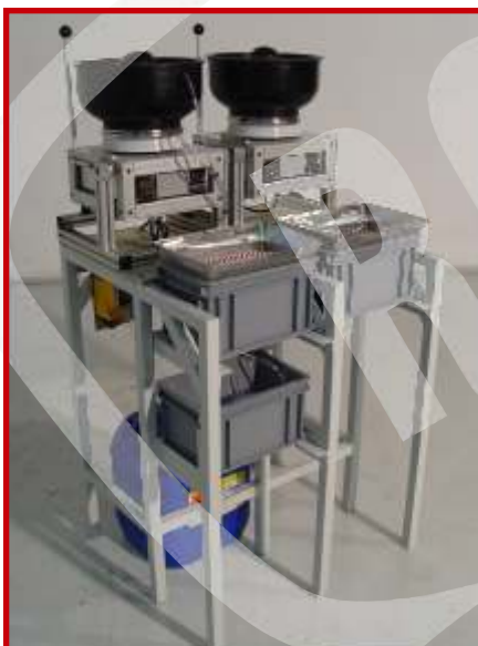
Minor XS 6 PRO K2 WD