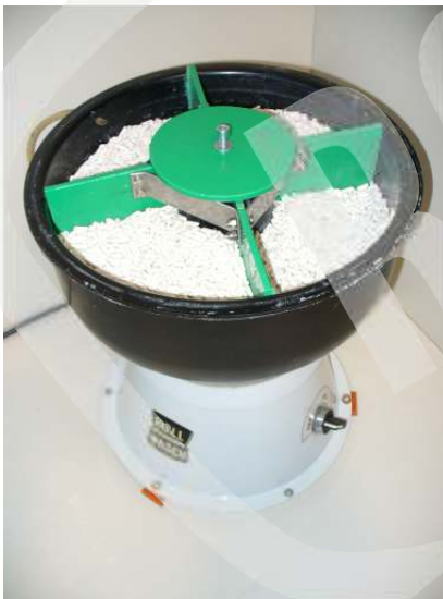
Minor XS 6 + Splitter 4 XS6