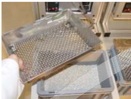
Minor XS 6 PRO K2 WD

The Series Minor XS PRO K2 / K3 represents the evolution of project Minor XS PRO, with the ability to combine multiple machines, also type "MINI-MAG" in a rational workstation.